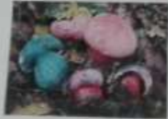
AMANITA MUSCARIA TUMIDA IN TENDINA