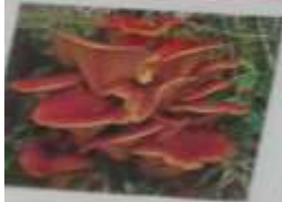
AMANITA MUSCARIA TUMIDA IN TENDINA