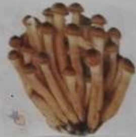
AMANITA MUSCARIA TUMIDA IN TENDINA