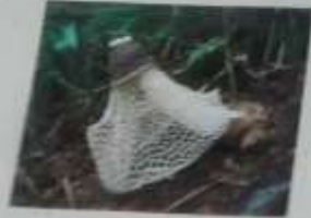
AMANITA MUSCARIA TUMIDA IN TENDINA