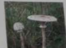
AMANITA MUSCARIA TUMIDA IN TENDINA