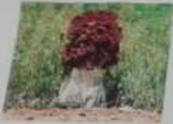
AMANITA MUSCARIA TUMIDA IN TENDINA