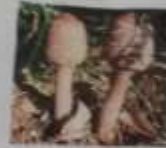
AMANITA MUSCARIA TUMIDA IN TENDINA