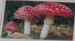
AMANITA MUSCARIA TUMIDA IN TENDINA