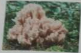
AMANITA MUSCARIA TUMIDA IN TENDINA