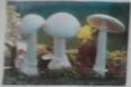
AMANITA MUSCARIA TUMIDA IN TENDINA