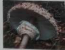
AMANITA MUSCARIA TUMIDA IN TENDINA