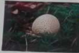
AMANITA MUSCARIA TUMIDA IN TENDINA