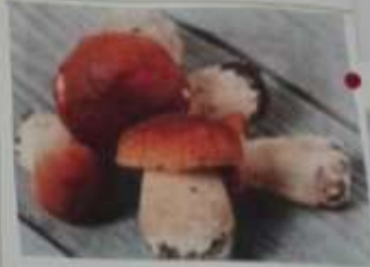
AMANITA MUSCARIA TUMIDA IN TENDINA